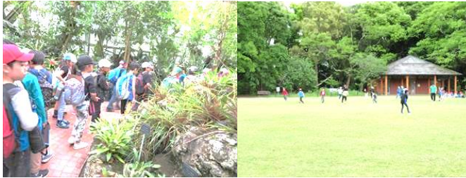
3年京都府立植物園