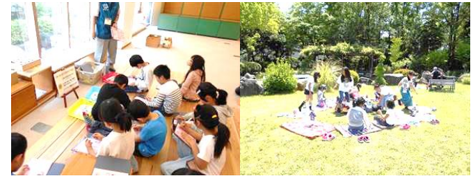
4年京都青少年科学センター 都エコロジーセンター